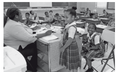
Lehrerin mit Schülerin

Im weltweiten Vergleich bescheidenen Statistiken den Bahamas bei der wirtschaftlichen Gleichstellung von Frauen einen Platz im oberen Drittel. Im Jahr 2013