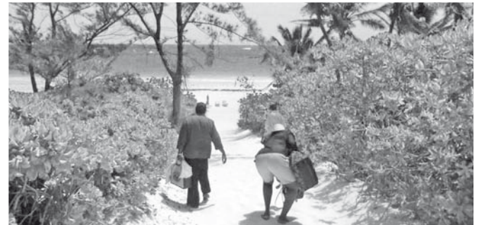
Frauen auf dem Weg zum Strand auf den Bahamas